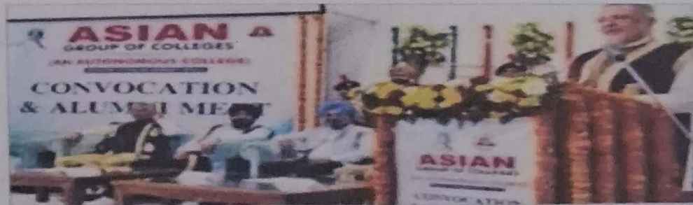
ਕਾਨਵੋਕੇਸ਼ਨ ਨੂੰ ਸੰਬੰਧਨ ਕਰਦੇ ਹੋਏ ਸਿਹਤ ਮੰਤਰੀ ਡਾ. ਬਲਬੀਰ ਸਿੰਘ।

ਬਿਗਰੀਆ ਪ੍ਰਦਾਨ ਕਰਨ ਮੌਕੇ ਸਿਹਤ ਮੰਤਰੀ ਨੇ ਕਿਹਾ ਕਿ ਨੌਜਵਾਨ ਆਪਣੀ ਕਾਬਲੀਅਤ, ਮਿਹਨਤ ਅਤੇ ਲਗਨ ਨਾਲ