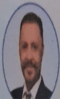
Hon'ble Dr. Balbir Singh Minister of Health & Family Welfare of Punjab