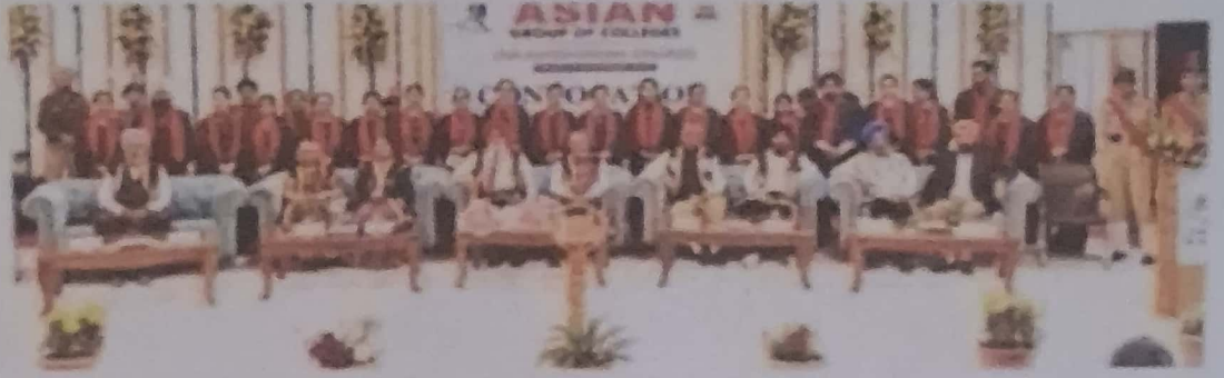
दीक्षांत समारोह में भाग लेते सेहत मंत्री डॉ. बलवीर सिंह, कालेज प्रबंधक व स्टूडेंट्स।

स्वास्थ्य मंत्री ने एशियन ग्रुप ऑफ कॉलेज के दीक्षांत समारोह में भाग लिया